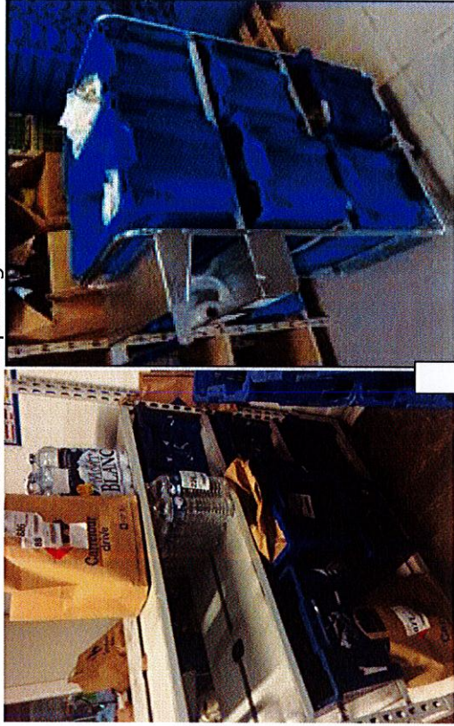
Evolution du chariot picking