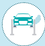
Émissions de moteur Diesel