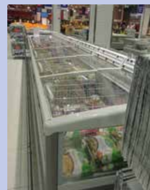
Volets coulissants sur coffres surgelés