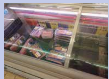
Coffre surgelé avec grille de fond ajustable