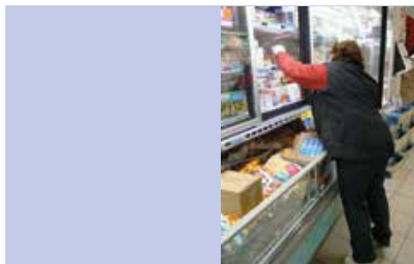
Mise en rayon dans un meuble «requin»