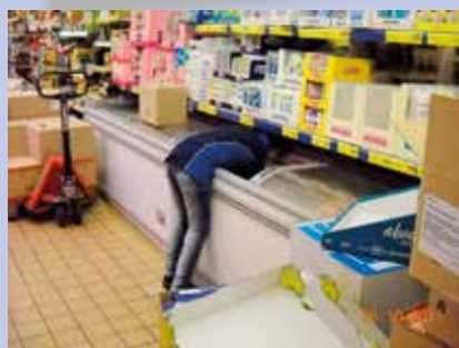
Chargement de produits dans un coffre à surgelés