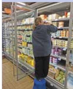
Mise en rayon dans des armoires réfrigérées