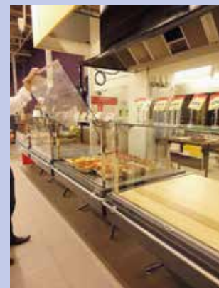
Meuble traiteur : vitre avant escamotable