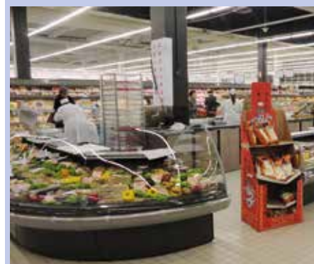
Pare-chocs intégrés aux mobiliers